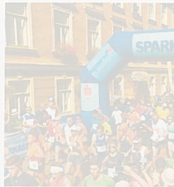
Laufen ist in – wie hier beim Start zum 14. internationalen Erzberglauf.

„Malerisch“ wird es am Sonntag. Zum achten Mal findet in Tragöß-Grüner See der Boehle-