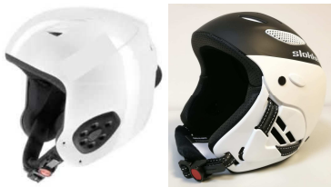
Beispiele: Schutzhelm mit Vollschale und Höröffnung